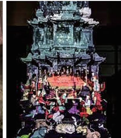
그림 7. 국립중앙박물관 &lt;하늘 빛 탑&gt;