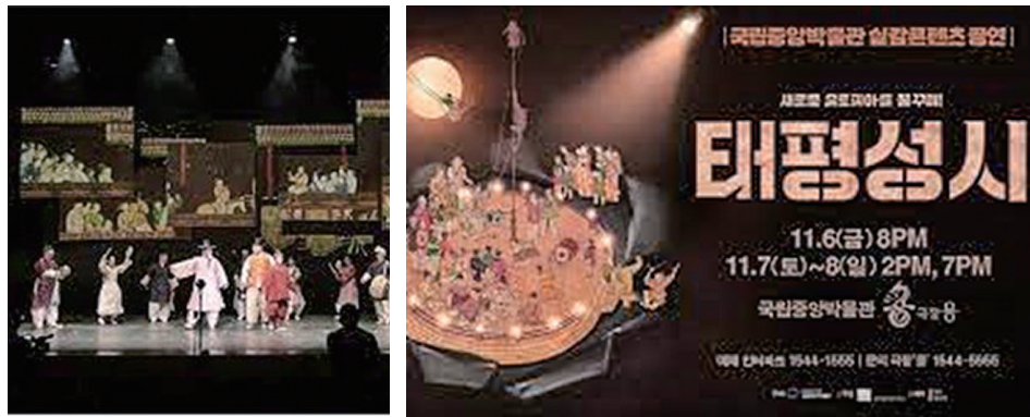
그림 2. 국립중앙박물관 <태평성시: 새로운 유토피아를 꿈꾸며>.

그런가 하면 2020년 무대에 오른 공연 <태평성시: 새로운 유토피아를 꿈꾸며>는 국립중앙박물관에서 제작한 문화유산 기반 실감 콘텐츠 공연이다. 18세기 후반, 8폭 병풍에 그려진 조선회화 <태평성시도>를 모티브로 제작되었다. 회화 <태평성시도>는 당대인들이 꿈꾸었던 이상사회를 담은 상상의 그림으로, 공연은 그림 속 장면들이 무대 위에서 움직이는 그림으로 되살아나고 이상세계의 서사가 공연의 중심을 이룬다. 이를 위해 3D 프로젝션 매핑 기술과 다양한 인터랙티브 기술이 적용되어 시공간을 초월한 상상의 무대를 구현한다. 또한 달항아리를 비롯한 여러 한국의 문화유산들이 홀로그램으로 무대 위 공간 위를 부유한다. 여기에 국악과 현대음악, 탈춤 등의 연희 종목이 융합된다. 이 공연에서 첨단기술은 물리적 무대 장치의 한계를 넘어 예술의 상상력과 전통예술의 구현에 핵심이 된다. 평면적이던 문화유산과 유물의 감상은 실감 영상기술, 무대공연과 융합되며 “입체적이고 경쾌한 느낌으로 경험할 수 있게 된 것이다” 11