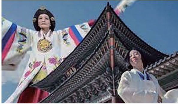
그림 8. 문화재청 &lt;태평하기를&gt;

그런가 하면 국립국악원의 국악박물관은 박물관 리뉴얼 작업을 통해 인터랙티브 미디어 전시와 체험전시를 구상하여 2020년 재개관하였다. 5개의 전시관으로 구성하면서 미디어 아트, 3D 악기소개, 고악보 연주법을 소개하는 미디어 월과 터치스크린을 활용한 고악보 연주법 소개와 국악기 체험, 구글과 협업하여 기가 픽셀로 촬영한 영상과 인터랙티브 테이블로 유물을 소개하는 <임인진연도병> 등이 전시되어 있다. 국악기 합주체험의 인터랙티브 테이블도 설치되어 있다. 그런가 하면 2021년에는 몰입형 영상체험콘텐츠로 <진연(進宴)_120년의 시간을 잇다>도 공개되었다. 2부로 구성된 <진연>은 국립국악원에 소장중인 <임인진연도병>에 그려진 1902년 고종의 기로소 입소를 축하하는 덕수궁 함녕전 뜰의 연향의 일부를 3면의 스크린에 영상으로 재현한 것이며 이어 국악박물관 국악뜰에 전시된 궁중악기에 빛을 입혀 악기를 눈과 귀로 체험할 수 있게 해주는 체험형 콘텐츠이다.