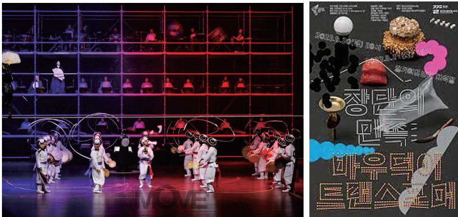
그림 4. 경기시나위오케스트라, 안성시립바우덕이풍물단 <장단의 민족: 바우덕이 트랜스포머>

2022년 공연된 <장단의 민족: 바우덕이 트랜스포머>는 남사당놀이를 소재로 한 공연으로 경기시나위오케스트라와 안성시립바우덕이풍물단의 공연으로 무대에 올랐다. 공연은 연희의 과장을 도입하여 총 다섯 과장으로 구성되어 있다. 줄타기, 버나, 꼭두각시 놀음, 길놀이 등 남사당의 요소를 국악의 다른 요소들을 ‘믹스매치’하여 융합하는 방식의 연출이 돋보였다. 안성의 유일한 여성 예인이었던 바우덕이의 줄타기에 함께 연행한 상모들리기에서는 풍물의 ‘소리’를 제거하고 연행자의 몸짓을 부각시킴으로서 영화의 한 장면같은 트랜스미디어 효과를 내는 극적 연출이 돋보였다. 이러한 연출은 풍물의 ‘흥’의 감정을 슬픔의 ‘페이소스’와 불안함의 ‘이어리(eerie)’적 감정을 오가는 새로운 감성을 구축했다. 접시들리기에서 유래한 연희 버나에서는 카메라를 연희연행자의 집중된 얼굴을 클로즈업하며 보여줌으로서 ‘기예’보다 ‘예인’을 부각시킨다. 또한 줄타기에 경기 민요 오봉산 타령, 버나에 전통성악 가곡을 함께 배치하고, 의상, 무대미술, 조명, 영상, 관객참여 등의 동시대적 요소를 융합했다. 이러한 신선