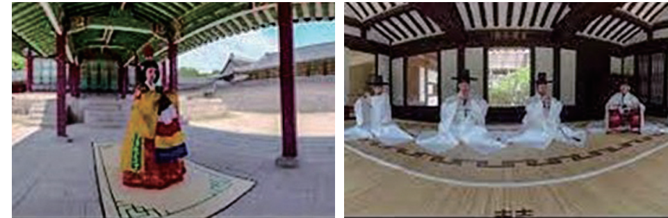
그림 9. 국립국악원 &lt;국악 VR&gt;