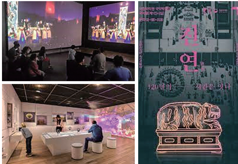
그림10. 국립국악원 국악박물관 체험전시.

앞서 본 연구에서 소개한 사례를 통해 진주 창의도시의 과제를 완수하고 실천하는데 필요한 다섯 가지 제언을 도출할 수 있다. 첫째 진주의 공예와 민속예술을 활용한 ‘웰 메이드’ 공연작품을 만들어 국내·외 무대에 선보이는 것이다. 특히 현재 다양한 공연기술의 접목으로 기존에 구현하지 못했던 다양한 스토리텔링을 구상할 수 있다는 장점이 있다. 그러나 무엇보다 중요한 것은 ‘기술’이 목적이 되어서는 안되며 문화유산과 전통이 가진 역사성과 전통성에 진정성과 예술성을 담는 연출로 완성도 높은 작품으로 동시대 관객에게 감동을 줄 수 있어야